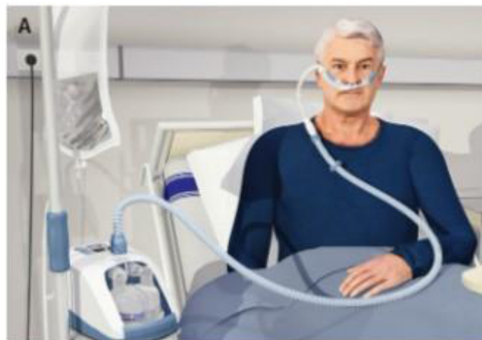
Figura 1. Empendium, manual mibe 2024

Se demostró en un estudio realizado que en pacientes adultos con neumonía con insuficiencia respiratoria aguda tratados con CNAF, el ROX es un índice que puede ayudar a identificar aquellos pacientes con bajo y alto riesgo de intubación. (8) El presente trabajo tiene por objetivo realizar una revisión sistemática para describir la implementación de la cánula nasal de alto flujo en la falla respiratoria hipoxemia de novo en pacientes adultos hospitalizados.